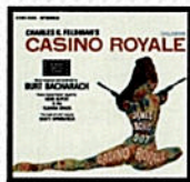
Burt Bacharach Casino Royale 1967